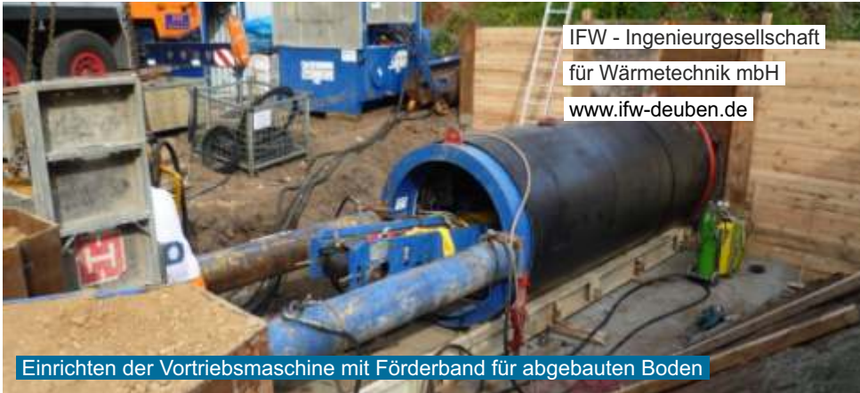
IFW - Ingenieurgesellschaft für Wärmetechnik mbH www.ifw-deuben.de