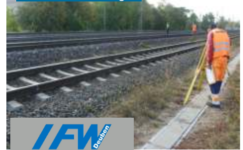
Kontinuierliche Gleislage- und Höhenmessungen

Medientunnel 2. Phase: In das Stahlbetonrohr DN1400 wurden weitere Stahl-schutzrohre DN100 bis DN400, sowie Kunststoffrohre DN110 PVC-U auf speziell angefertigten Stahl-halterungen montiert und mit Hilfe einer Führungsschiene eingefahren. Anschließend wurden die Medienrohre für Fernwärme, 2x DN150 KMR und für Gashochdruck, 1x DN100 St; PE-ummantelt, auf Kunststoffgleitkufen eingezogen. Da sich die Enden des Stahlbetonschutzrohres DN1400 mit gut 2/3 seines Querschnittes über der Geländeoberkante der angrenzenden Flurstücke befinden, wurde auf Endbauwerke verzichtet. Maßangefertigte Gitter verschließen jeweils die Enden des Stahlbetonrohres. Autor & Ansprechpartner