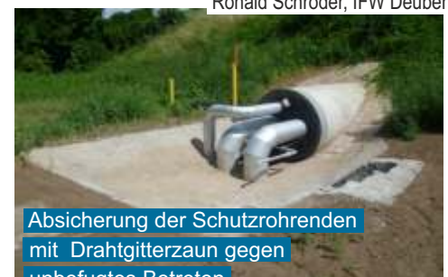
Absicherung der Schutzrohrenden mit Drahtgitterzaun gegen unbefugtes Betreten