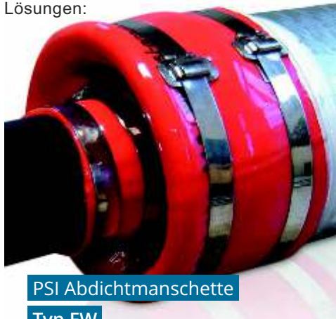
PSI Abdichtmanschette Typ FW

Der wasserdichte Abschluss von Schutzrohrmaßnahmen und/oder das wasserdichte Abdichten von Schacht- und Hauseinführungen bei Fernwärmerohrleitungen erfordert immer eine besondere Beachtung während der Planung und auch während der Durchführung von von Baumaßnahmen im Fernwärmerohrbereich. PSI Products GmbH hat hier die passenden und baustellengerechten Lösungen: