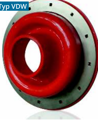
PSI Abdichtmanschette Typ VDW

Die PSI Abdichtmanschetten Typ FW wurde speziell entwickelt, um einen druckdichten Abschluss zwischen Mediumrohren und Mantelrohren zu gewährleisten. Die Manschetten bestehen aus hochwertigem Rottolin und sind durch ihre Wandstärke von ca. 9-11 mm sehr formstabil und druckdicht bis 0,5 bar. Durch ihre hohe Flexibilität erlauben die