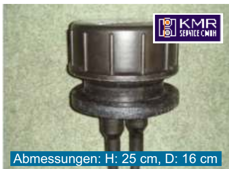
Abmessungen: H: 25 cm, D: 16 cm

Auf der Suche nach Alternativen zu Messstellenposten, Kabelschrank oder Gelsnap hat die KMR Service GmbH aus dem vorpommerschen Penzlin unter Einbeziehung langjähriger Praxis-Erfahrungen den innovativen „Wasserdichten MessPunkt“ (Kurzbezeichnung: WMP) entwickelt. Bei Vorstellungen auf Fachmessen stieß der WMP bereits auf große Resonanz in der Fernwärme Branche.