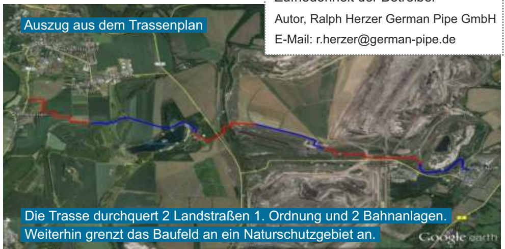
Auszug aus dem Trassenplan

Autor, Ralph Herzer German Pipe GmbH E-Mail: r.herzer@german-pipe.de