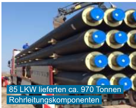
85 LKW lieferten ca. 970 Tonnen Rohrleitungskomponenten

In der Zeit vom März bis Oktober 2015 gelang es, zwischen Profen und Hohenmölsen / Zembschen diese neue 10 km lange Fernwärmetrasse DN 250 zu verlegen und in Betrieb zu nehmen. Der Trassenverlauf begann dabei am Ortseingang Zembschen und wurde in die Trasse DN 300 nach Deuben eingebunden. Nach der Einbindung verläuft die Trasse bis zu Beginn des Freizeitparks Pirkau überwiegend auf privater Flur, entweder über Ackerflächen oder unbefestigte