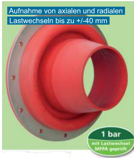
Aufnahme von axialen und radialen Lastwechseln bis zu +/-40 mm