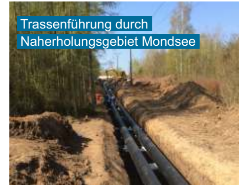
Trassenführung durch Naherholungsgebiet Mondsee

Projektes wurde der Tiefbau an zwei regionale Unternehmen sowie die Verlegung an die Unternehmen Pfaffinger Leipzig und Umwelt- und Wasserbau Jena vergeben. Bei der Materiallieferung entschied sich der Bauherr für Qualität und Zuverlässigkeit aus Thüringen. Mit der Belieferung von Kunststoffmantelrohrkomponenten wurde die German Pipe GmbH aus Nordhausen .